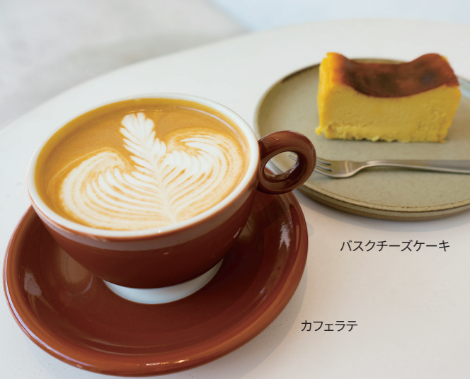
バスクチーズケーキ