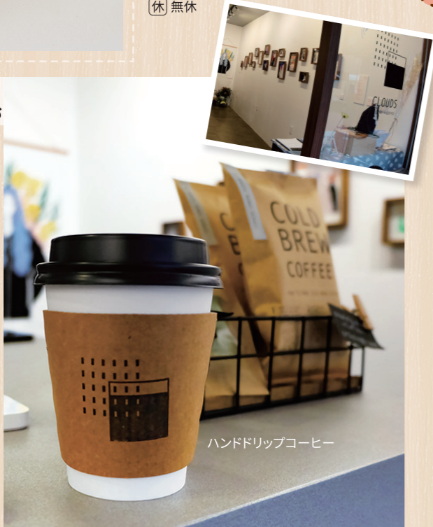
ハンドドリップコーヒー