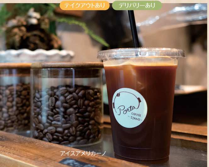
アイスアメリカノ