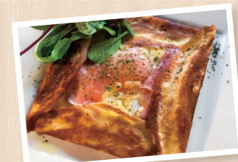
生ハムと卵とチーズのガレット風クレープ