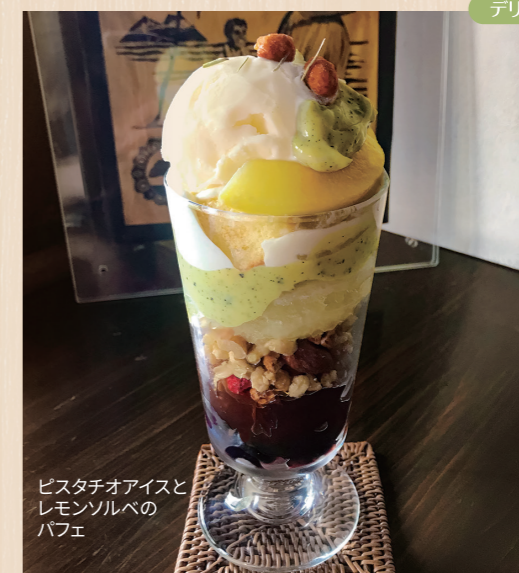
ピスタチオアイスとレモンソルベのバフェ

高円寺では貴重なモーニング営業のカフェ。店名はハワイの言葉で「散歩する」。ふらっとまち歩きの中で入りたくなるお店だ。モーニングではガレット風クレープやパンケーキセットを年間提供。フードメニューは本格的なエスニックやカレー、パスタと幅広く、日替わりランチなどの一部メニューはテイクアウトOK。