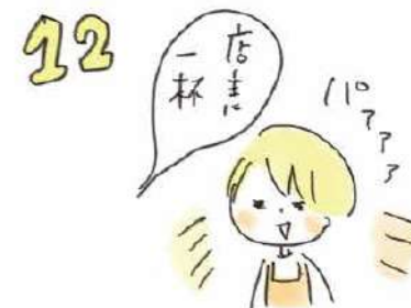
12 お気に入りのお店で「店主に一杯!」と声をかけると、店主は笑顔になります。でも、これはルールではありません。