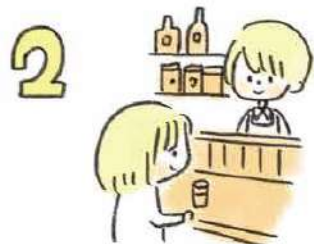
2 「どこでもどうぞ」と言われたら、ぜひカウンター席へ。店主と話しやすい、特等席です。