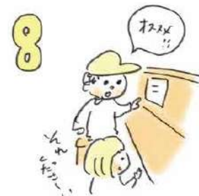
8 とはいえ、常連さんは「ひとと飲み」の味方！オススメの料理やお酒を聞いてみると盛り上がる！