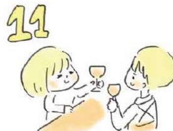
11 店主に「一杯どうぞ」とお酒を出す人もいます。でも、はじめてのお店では必要ありません。