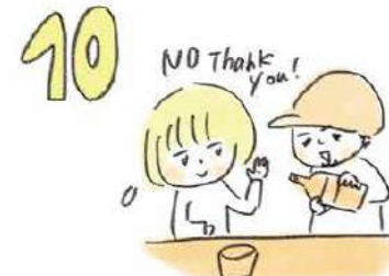
10 お酒はあくまでも自分のペースで!! 勧められても、無理する必要は絶対ありません。