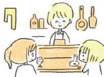
7 はじめてのお店では、むやみに隣の人に話しかけるのではなく、店主さんや店員さんを介して、自然な流れで。