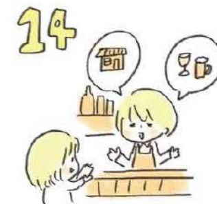
14 はしご酒したい時は、お店の人に次の店を教えてもらおう。どんなガイドブックよりも濃い情報をゲットできます!