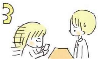
3 着席してすぐ、スマホや本とにらめっこしないのもポイント。声をかけづらくなっちゃいます。