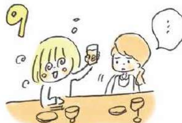
9 お酒の勢いを借りての入店やコミュニケーションもいいですが、酔っ払いすぎには気をつけて！