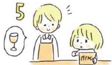
5 飲み物や食べ物に迷ったら、店主さんや店員さんに聞きましょう。オススメを教えてもらえるし、話のきっかけになります。