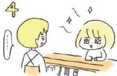
4 店主と目を合わせてみるなど、話しかけてオーラを発するのもオススメです。