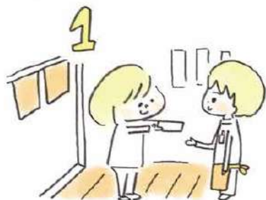
1 席に座る前に「ひとと飲み」カードを渡しましょう。最適な席に通してくれるはず。