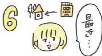
6 オススメのキーワードは、「最近、引越してきました」、「最近、ひとり飲みはじめました」。いろいろ教えてくれるはず。